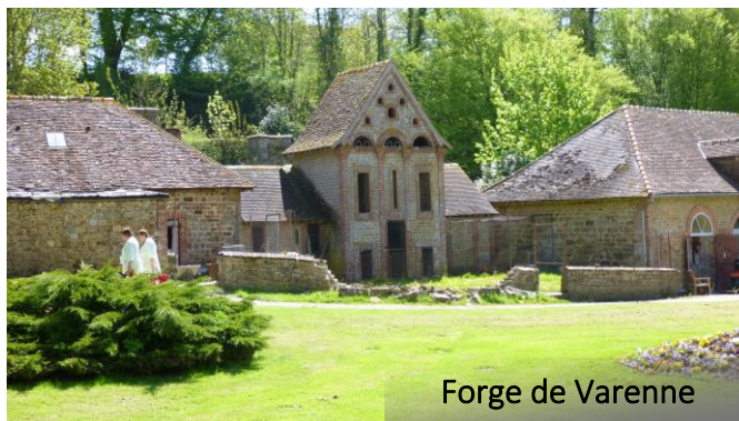
Forge de Varenne

Programm mit den Gastgebern z.B. Ausflüge in Flers und Umgebung